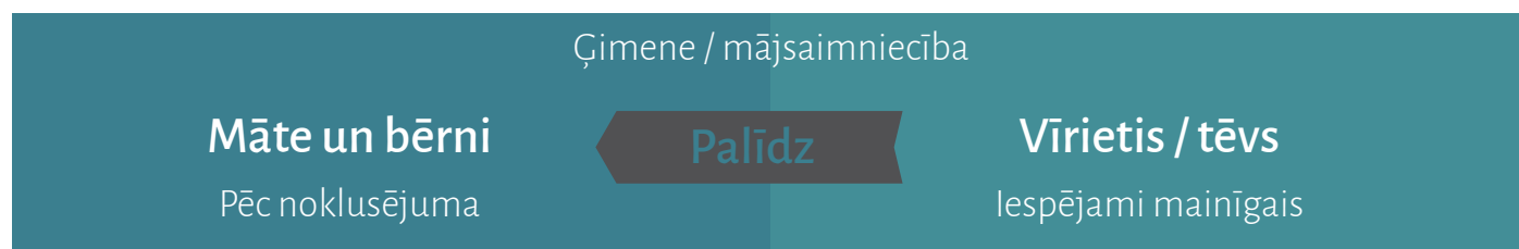
Attēls 1. Ģimenes/mājsaimniecības kognitīvais modelis

Attēls 1. ilustrē vienkāršotu ģimenes/ mājsaimniecības kognitīvo modeli. Šis modelis nav jāuzskata par tādu, kas apzināti pastāv aktīvi un apzināti lietotajā folkteorijās par to, kas un kādā veidā ietilpst ģimenē. Modelis ir jāuzskata par mēģinājumu konceptualizēt intervijās novērotos domāšanas modeļus - kognitīvos rāmjus.